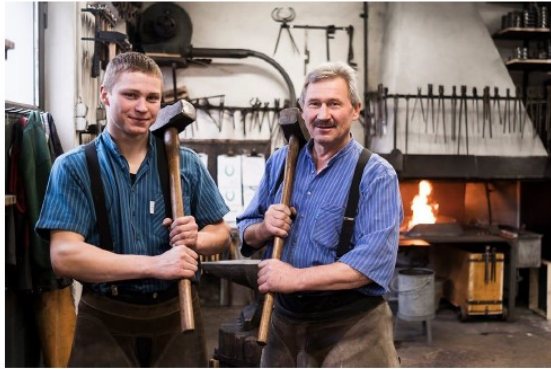
Hufschmied Eggenberger Amriswil

Tag der offenen Tür Sonntag, 25.09.2022 11 00 - 16 00 Uhr