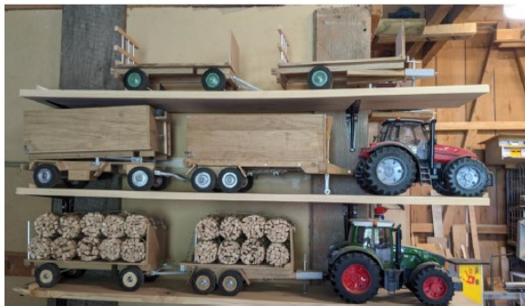
Werner Egger Tufertschwil